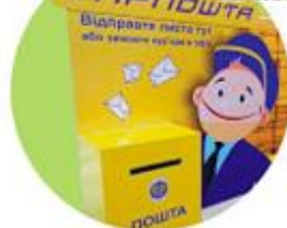
ОПЕРАТОР ПОШТОВОГО ЗВ'ЯЗКУ