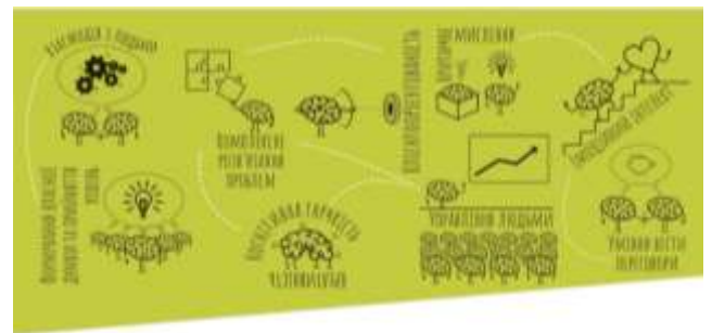
Як зберегти гармонію між роботою і життям?

мій час – одягаю навушники, переходжу в окрему зону офісу. І це не означає, що треба бути роботом. На «гнучке» планування я залишаю десь третину всього часу. Я спілкуюся з колегами, телефоную дружині, читаю новини. Але не менше 60% мого робочого дня – жорстко сплановані, націлені на результат.