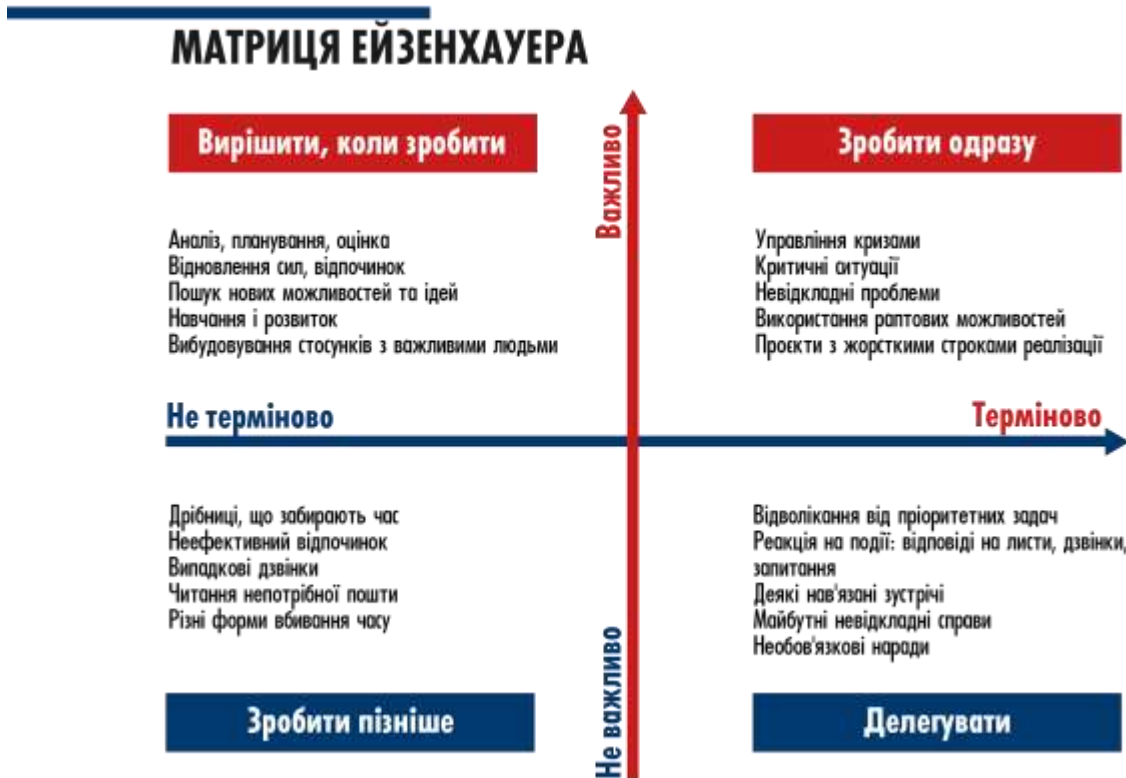
ТАБЛИЦЯ «МАТРИЦЯ ЕЙЗЕНХАУЕРА»

Заповніть матрицю Ейзенхауера – розпишіть, розподіліть завдання згідно пріоритетів