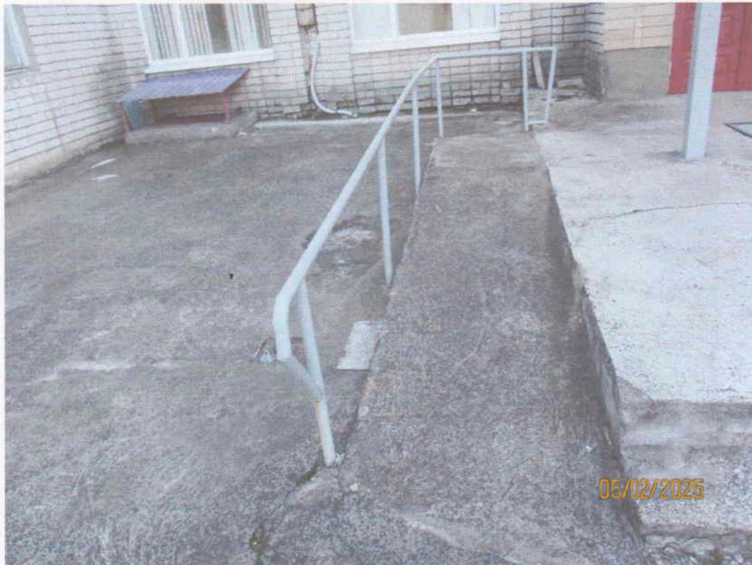
Мал. 1. Зовнішній вигляд пандуса для мало мобільних груп населення до нежитлової будівлі навчального корпусу по вул. Залізняка, 4