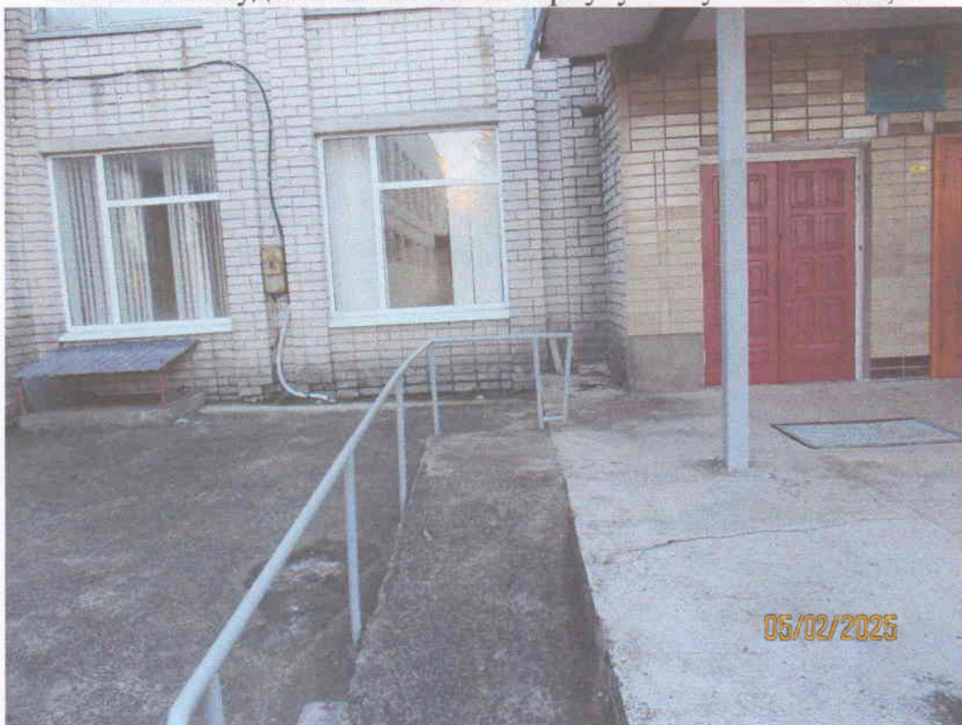
Мал. 2. Зовнішній вигляд пандуса для мало мобільних груп населення до нежитлової будівлі навчального корпусу по вул. Залізняка, 4