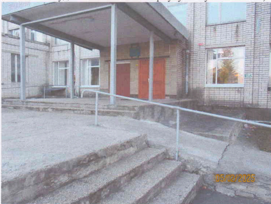
Мал.4. Загальний вигляд пандуса для мало мобільних груп населення до нежитлової будівлі навчального корпусу по вул. залізняка, 4