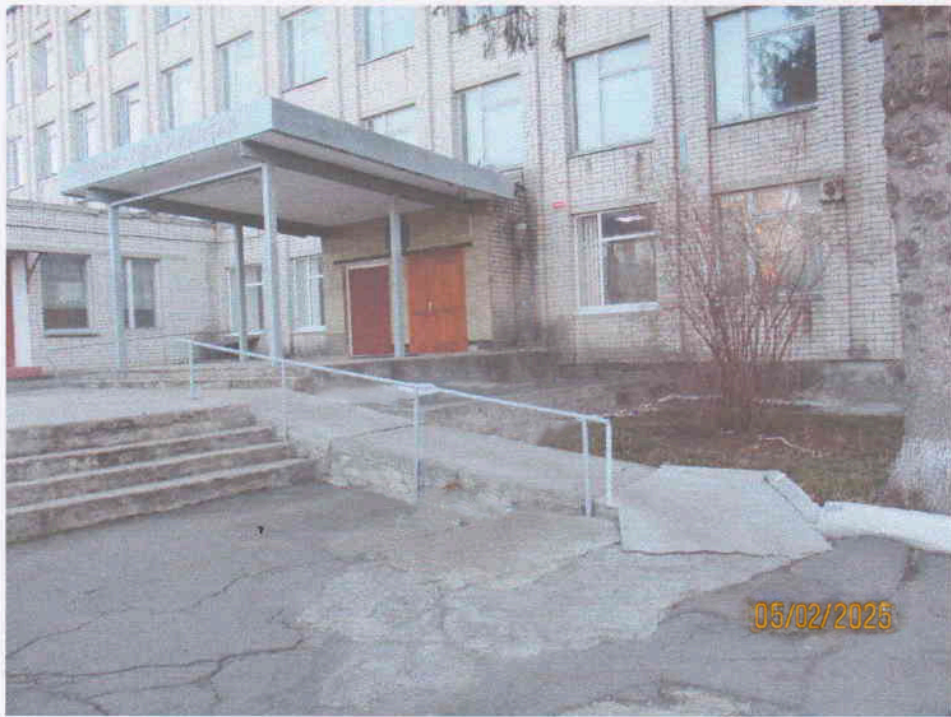
Мал. 3. Загальний вигляд пандуса для мало мобільних груп населення до нежитлової будівлі навчального корпусу по вул. залізняка, 4