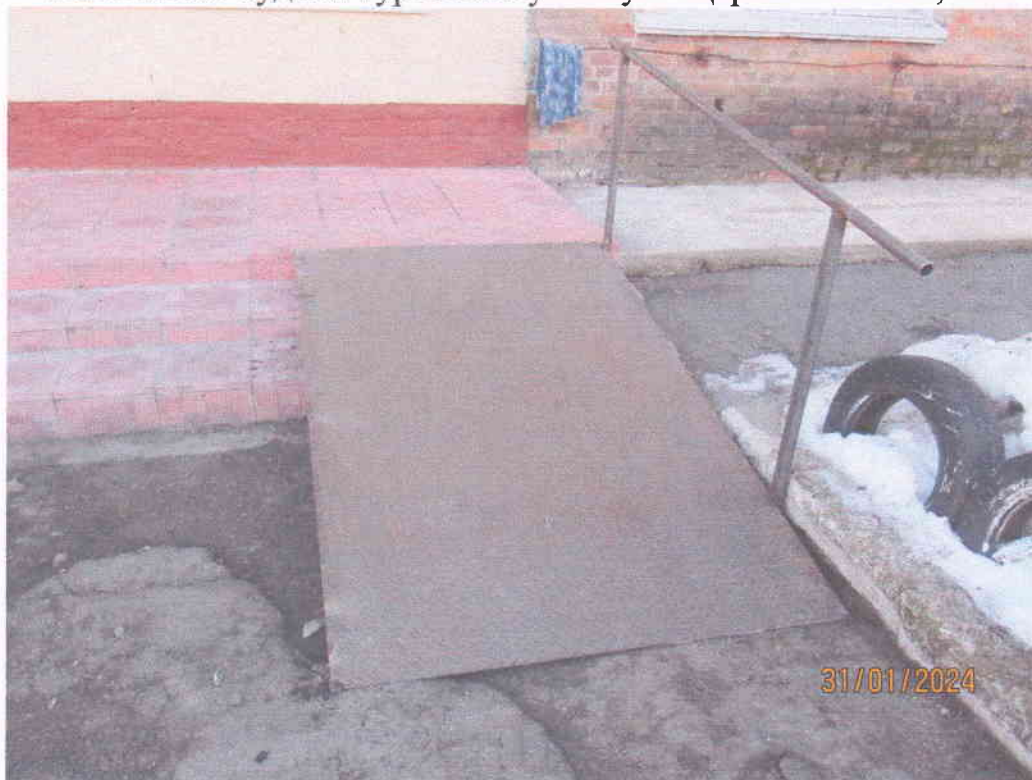
Мал. 2. Зовнішній вигляд пандуса для мало мобільних груп населення до нежитлової будівлі гуртожитку по вул. Щербаківського, 4-а