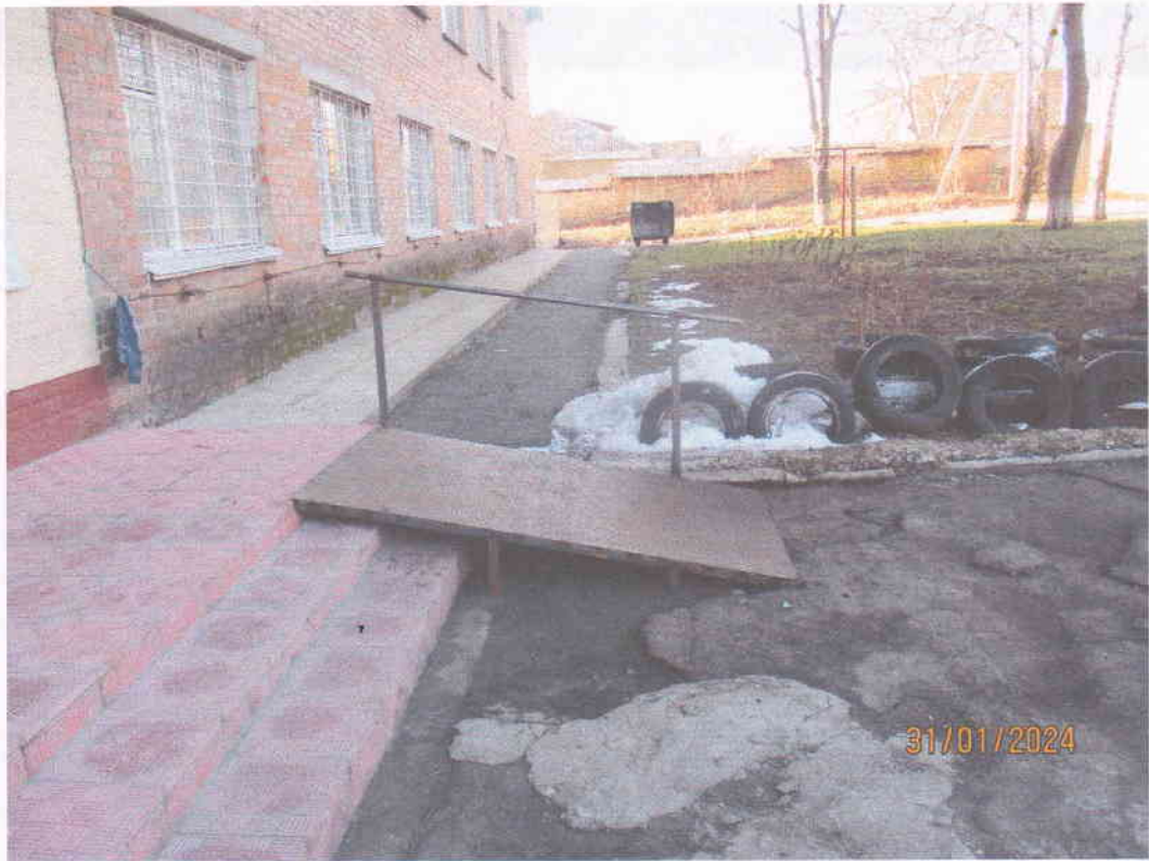
Мал. 3. Загальний вигляд пандуса для мало мобільних груп населення до нежитлової будівлі гуртожитку по вул. Щербаківського, 4-а