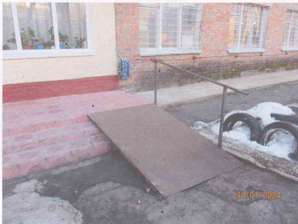
Мал. 1. Зовнішній вигляд пандуса для мало мобільних груп населення до нежитлової будівлі гуртожитку по вул. Щербаківського, 4-а